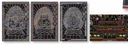
〈馬頭観音〉 〈阿彌陀如来〉 〈千手観音〉 〈三仏堂〉